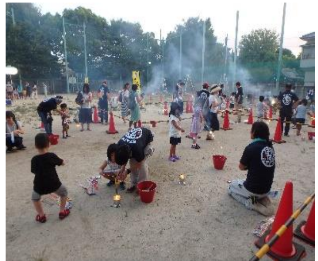
* 過去開催の花火教室